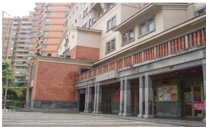
圖 7-2-13 淡江教會與鄞山寺比鄰而居