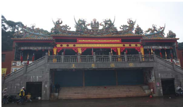
圖 7-3-3 小坪頂集應廟

淡水奉祀張李莫三姓王爺的宮廟共有 3 座，分別為協元里的鎮龍宮及義山里的鎮安宮和鎮天宮。前 2 者，皆創建於民國 77 年後者係民國 98 年方自北投遷入；3 廟的最初源頭，都是分香自雲林縣台西鄉五條港主祀張李莫三千歲的安西府。3 宮所奉祀之張李莫三王爺中的張王爺，即是張巡；如是奉祀形態，和前 2 者皆有極大不同，主要的祭典為 6 月 10 日的張巡聖誕，平時則常藉由乩身幫信徒解決問題。