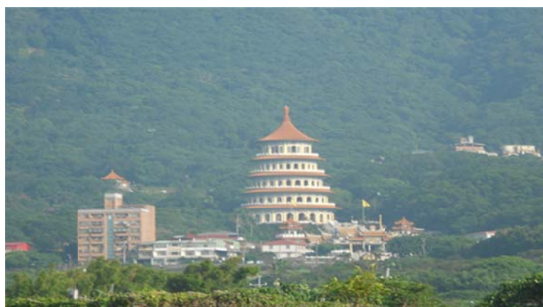
圖 7-2-4 淡水天元宮的天壇

相較於傳統的天師、靈寶等道教流派，天元宮實具有奉瑤池金母(母娘)為最高神靈、以靈乩聖示為主要依歸、以收圓普渡為根本任務、使命、不舉行齋醮法事、共崇儒釋道三教神靈、教義等等特質。這些特質，和許多民間教派及會靈山的宗教團體，存在一些共通處。但因其登記為道教，自我認同亦偏向於道家或道教，所崇奉神靈，雖含括佛、道二教，惟仍以道教神居多，故可被視為臺灣戰後新興的一個道脈或道教團體。