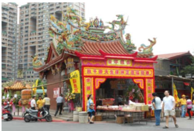
圖 7-2-5 淡水廟宇以土地公廟最多。圖為北投仔福德宮