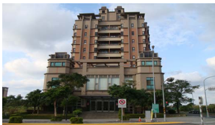
圖 7-2-22 淡水一貫道凱德聖道院

凱德聖道院所在地為淡水區崁頂里 5 鄰，鄰長是一貫道道親，因為崁頂里里民活動中心尚未興建，凱德聖道院提供場地做為里民活動中心的使用，積極服務社區，並將社區慈善服務工作與鄰長功能結合，透過鄰長申請公車(紅 18)在「凱德聖道院」設立站牌，嘉惠淡水臨近周邊至紅樹林的年長道親往來交通的便利。凱德聖道院結合地方鄰長的行政資源，共同推動社區慈善與關懷活動，在與社區的互動與道務的推展方面都獲得一定的成效。有鑑於臺灣人口老化的速度迅速，凱德聖道院將關懷老人服務列為未來道務規劃的重點，計劃每天開設不同的課程，如：健康操、書法課、善歌班等。