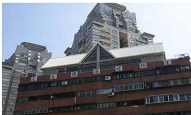
圖 7-2-12 淡水國語禮拜堂