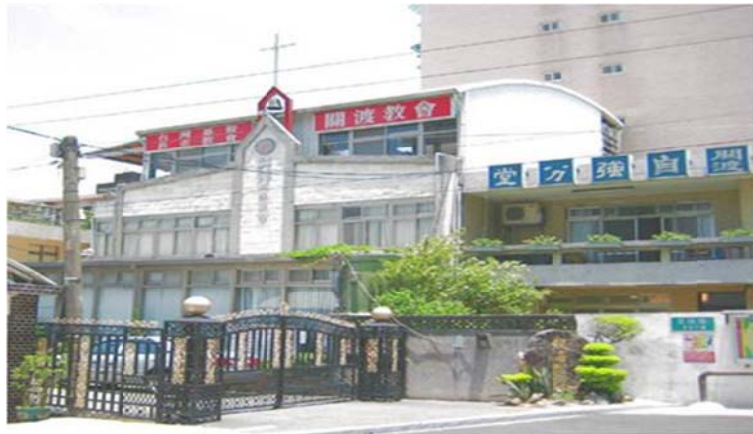
圖 7-2-16 關渡長老教會與信友堂關渡自強教會比鄰而居