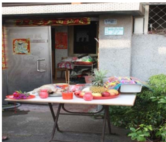
圖 7-4-1 淡水沙崙民家於七夕時祭拜七娘媽。供桌最右側之物即是七娘媽亭

淡水地區和臺灣大部分地方一樣，長久以來，並無任何官方或民間廟宇組織公開舉行成年禮儀式；但民間家庭透過對七娘媽及石頭公的祈禱、祭拜，則保存著類似「做16歲」的成年禮。在今日淡水，仍有不少住民，只要家中還有未滿16歲的小孩，便會於每年農曆的七夕「七娘媽生」時，於午後，準備牲醴、油飯、雞酒、燭臺及菊花(圓仔花)、雞冠花、粉餅、紅絨線、壽金、七娘媽衣等供品，祭拜被視為孩童的保護神——七娘媽，祈求七娘媽可以保佑家中小孩平安無事、順利長大。祭拜過後，即將此紅絨線取代舊線，同樣穿過銅錢或銀牌、鎖牌等物(此即所謂的「綦」)，讓小孩掛在脖子上，希望因此獲得七娘媽整年度的庇佑。到了小孩子16歲，在祭拜七娘媽時，則會準備比先前更為豐盛的供品，以及一座紙竹所糊或紙版拼接而成的「七娘媽亭」，特別答謝七娘媽16年來的保佑。此年之後，即可不再祭拜七娘媽，已經成年的孩童，也不須再掛帶綦牌，民間謂此為「脫綦」。淡水地區所保留的如是祭儀，雖不一定像開隆宮一般進行「出娘媽宮」的儀式，但也同樣具有成年禮的意涵。只是，這樣的祭儀，隨著時代、社會的演變，也有逐漸式微之現象。