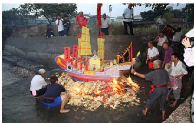
圖 7-2-3 油車口蘇府王爺廟的送王船儀式

保安廟的這種法師團體，在沙崙的忠義宮蘇府王爺廟亦可見到。該廟的年例祭典，係在每年陰曆的 9 月 8 日及 9 日舉行，主要的儀式有過火、繞境、拜天公、犒軍、普度及送王船等；此外，平日每逢初一、十五，蘇府王爺廟亦會舉行例行的犒軍、普施儀式。如是的這些祭典、儀式，除了拜天公通疏，是請淡水當地的靈寶派道士主持外，其餘皆是由廟中的法師配合王爺的乩童來施行，因此，這些法師在廟務中所扮演的角色相當重要。據該廟法師楊名鐵言，蘇府王爺廟目前所施行的過火、犒軍、送王船等法事，主要承傳自上一代，但其最初的源頭為何，已不太清楚。從其所使用的科儀文書內容來看，應當還是比較接近法派的三奶法。淡水一地，類似保安廟、蘇府王爺廟這樣，有駐廟法師的情形，還有位於八勢里的真武廟，據該廟法師說，其所傳承的祖傳法術，同樣是屬於閩山派的三奶法。