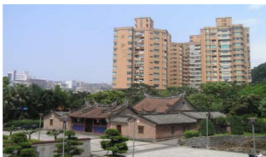
圖 7-2-6 淡水鄞山寺

臺灣主祀定光古佛的寺廟僅有 2 座，一是淡水的鄞山寺，一是彰化定光佛廟(舊稱定光庵)，建於 1761 年(乾隆 26)；此外，位於板橋的接雲寺則自光緒年間遷廟後加入定光古佛為配祀神。 47 鄞山寺目前是淡水的二級古蹟，1858 年(咸豐 8)重修，1873 年(同治 12)再修，大體上仍完整保存道光初年原貌，是全臺灣完整保存的一座定光佛寺， 48 目前仍由汀州移民來臺的江、蘇、游、練、胡、徐等 6 姓後裔管理。