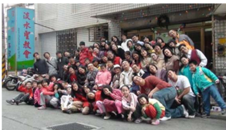
圖 7-2-14 淡水聖教會活動合照

民國81年時馬偕醫院有一群愛主的醫生，深深覺得竹圍這地區需要建立更多的教會。因此向中國宣教使命團負責人呂代豪牧師傳遞負擔。呂代豪牧師就請中國宣教使命團屬下的拓荒宣教神學院，每週一次派神學生至竹圍地區開始做鬆軟傳福音工作，一段時間後派神學院畢業生