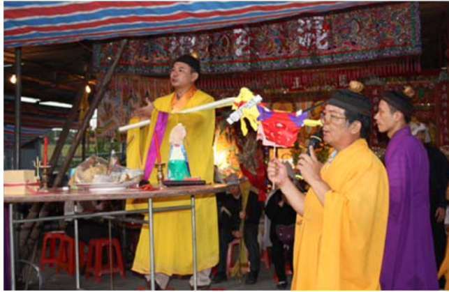
圖 7-2-2 淡水混玄壇道士施演功德儀式中的「走赦馬」