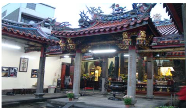
圖 7-2-7 淡水龍山寺

目前龍山寺定期敦請淡水普照寺或其他寺院的法師來舉行重要法會：農曆 1 月有新春祈福法會，2 月觀音聖誕禮斗法會、清明超薦法會，4 月浴佛法節，6 月開天門禮懺祈福法會、觀音成道日觀音祈福消災法會，7 月盂蘭盆法會，9 月觀音出家日有觀音祈福消災法會，12 月佛陀成到日祈福法會。 51 龍山寺聘請出家師父來講經、主持法會，可以視為從傳統民間信仰逐漸向佛教移動。