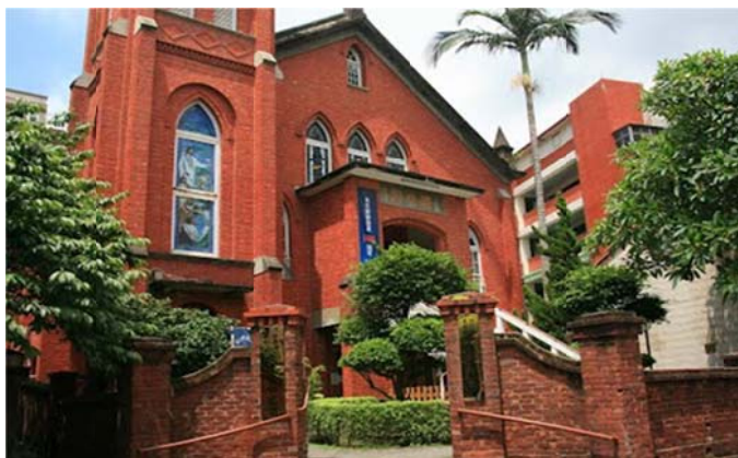
圖 7-2-11 淡水長老教會

在其教會運作方面，原設立的「新重光托兒所」仍持續營運；同時也將原古蹟「偕醫館」改成咖啡館，週二到週日營運，展示許多歷史與文物；定期支援馬偕安寧病房的探訪，並每主日到仁濟安老所帶領老人禮拜；除此之外，也至國外的泰北阿卡族、卡倫族短宣以及國內的五峰鄉桃山教會偏遠服務。同時也連結臺灣神學院，於每週二晚上開辦神學系的課程；近年來也加入「淡水聯禱會」，和淡水地區其他教派教會的牧長聯合一起禱告，儼然成為淡水地區之精神指標。