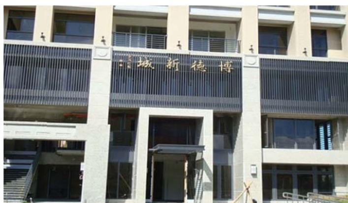
圖 7-2-21 一貫道淡水博德新城

屬於學界的博德新城，道務推動的重心以文化教育為主，鼓勵道親從事教職透過學校推廣社會教育工作。對於未來道務的推展，目標著重在齊家與社區化二方面，除了希望達到家人皆道親外，也希望進一步讓社區成員也成為道親。