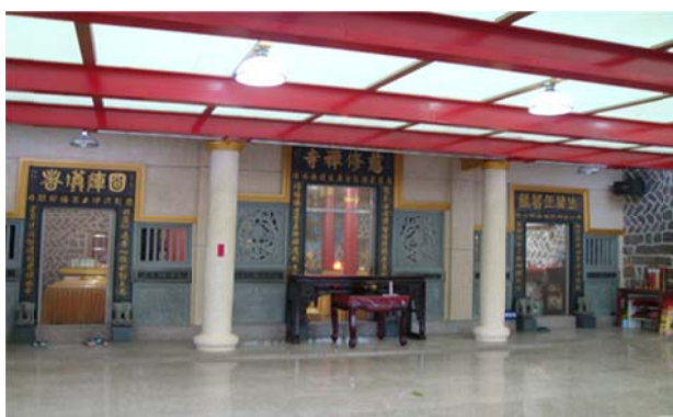
圖 7-2-9 淡水慈修禪寺

寺中重要活動為，農曆正月新春祈福法會、齋天法會，國曆 4 月的清明節報恩法會，農曆 4 月的浴佛暨春季祭典，農曆 7 月消災普渡法會，農曆 8 月初秋季祭典以及農曆 12 月 8 日的紀念釋尊成道大法會。平日每周三有共修課程。