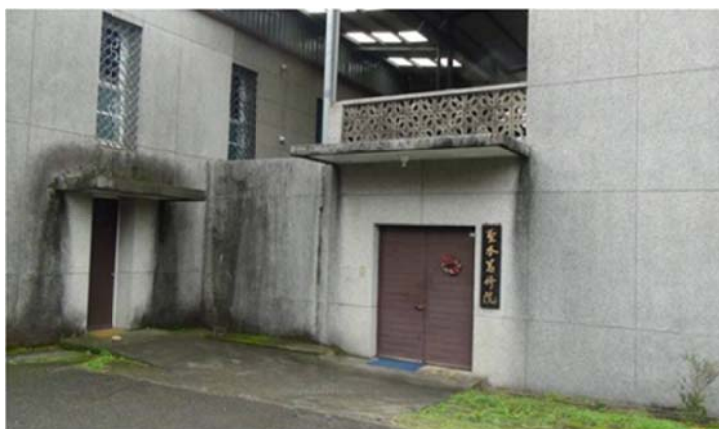
圖 7-2-18 淡水聖本篤修道院

淡水聖本篤修道院有 3 棟建築物，1、1961 年先蓋會士館，只限修女晉住；2、1962 年續建靈修中心，供靈修專用，開放給外界，不分信仰，只要遵守中心的規定；3、1963 年才建靜心會館，對外開放給偏向靈性的活動，收費是自由奉獻。創院初期，也曾開辦育兒院，孤兒院等，後因政府有了相關福利機構或另有專屬組織，才轉出去，而修道院則偏重離群索居的修行。