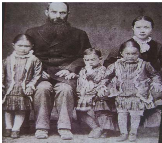
圖 7-2-10 馬偕牧師全家福照

當時馬偕教學的內容除了神學和聖經，還包括其他一般學科，上午讀書，下午去偕醫館實習，晚上有講道練習，互相批評討論。