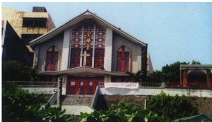
圖 7-2-17 從淡水國小眺望法蒂瑪天主堂

法蒂瑪天主堂附設有「福幼幼稚園」 144 ，已領洗信徒人數約200人，彌撒時間分為平日及主日，平日是早上7點至7點半，主日彌撒8點至8點半頌讀玫瑰經，9點至10點是國語彌撒，10點半到11點半是英語彌撒，每週參與主日彌撒人數(含中英文彌撒)平均共約140人。除此之外，每年從5月至10月連續6個月的13日都會擴大舉行朝聖感恩祭。