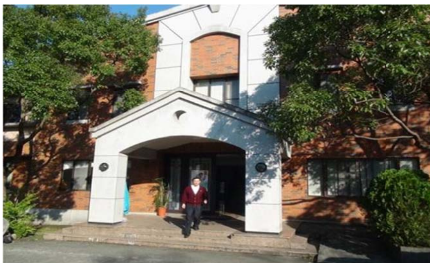
圖 7-2-20 世界和平統一家庭聯合會淡水研修院