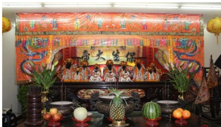
圖 7-3-2 八庄大道公保生大帝及三太子諸神像

張巡(709-757)為唐朝著名將領，安史之亂發生時，與許遠死守睢陽城，最後壯烈犧牲。死後，即被百姓奉為神靈，立廟崇祀，有尊稱為「保儀尊王」，亦有尊之為「保儀大夫」； 193 福建泉州安溪一帶，則謬稱其為「尪公」，其夫人林氏為「尪媽」或「尪娘」。