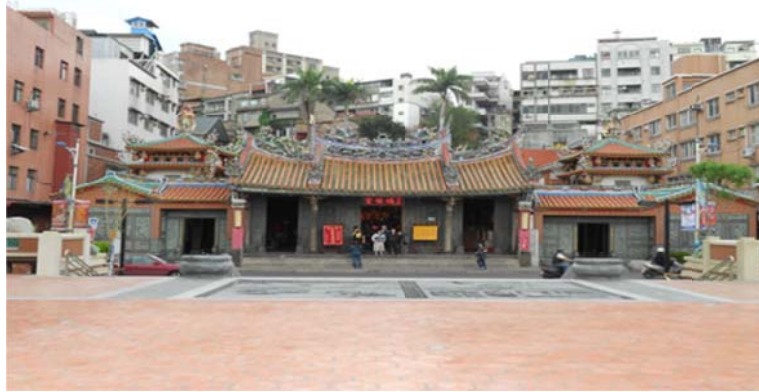
圖 7-3-1 福佑宮是淡水最早興建的大廟