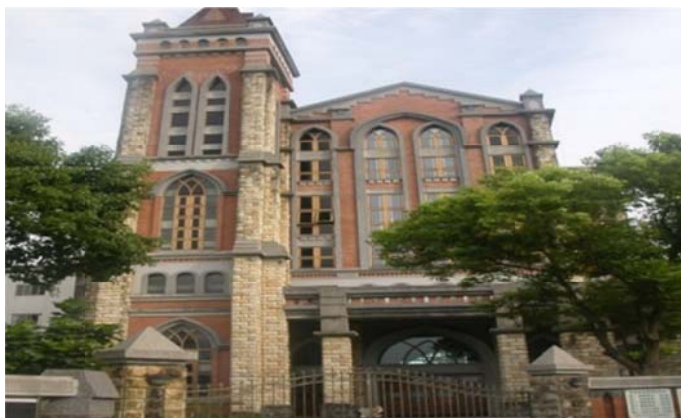
圖 7-2-19 淡水真耶穌教會宏偉的禮拜堂

「耶穌基督後期聖徒教會」(Church of Jesus Christ of Latter-day Saints)又稱為「摩門教」，創始者約瑟·史密。據說他在異象中看見「天使」向他顯現，指點他說世間任何宗派都是錯誤的。18 歲那年(1830)，天使「摩羅尼」向他顯現指引他發現一本重要經典也就是今日的《摩門經》。