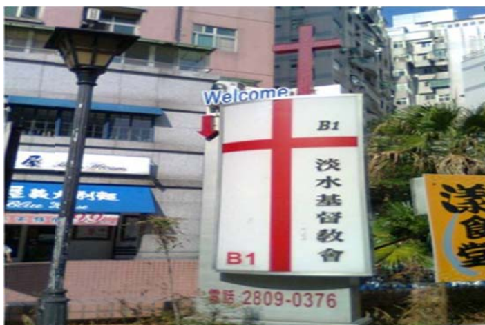
圖7-2-15 淡水基督教會在竹圍地區